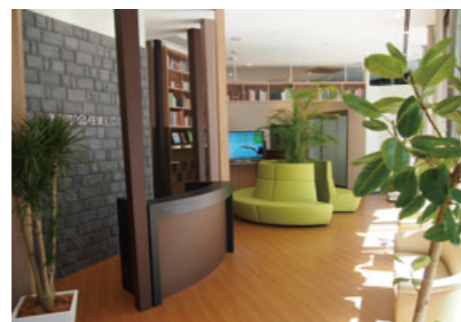
天井が高く開放感あふれる1階フロア

小田急不動産グループ 〒243-0018 神奈川県厚木市中町4-10-8 厚木アザレアビル ■あつぎ 小田急 住まいのプラザ ☎ 0120-096-209 http://www.odakyu-fudosan.co.jp/plaza/atsugi/