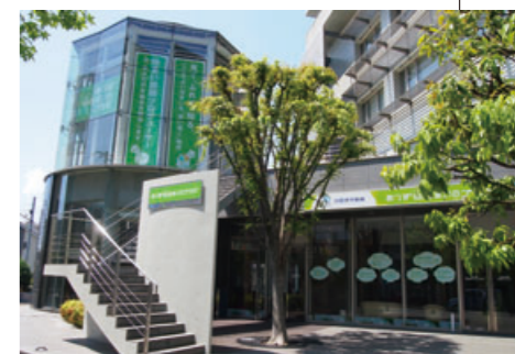
「あつぎ 小田急 住まいのプラザ」の外観