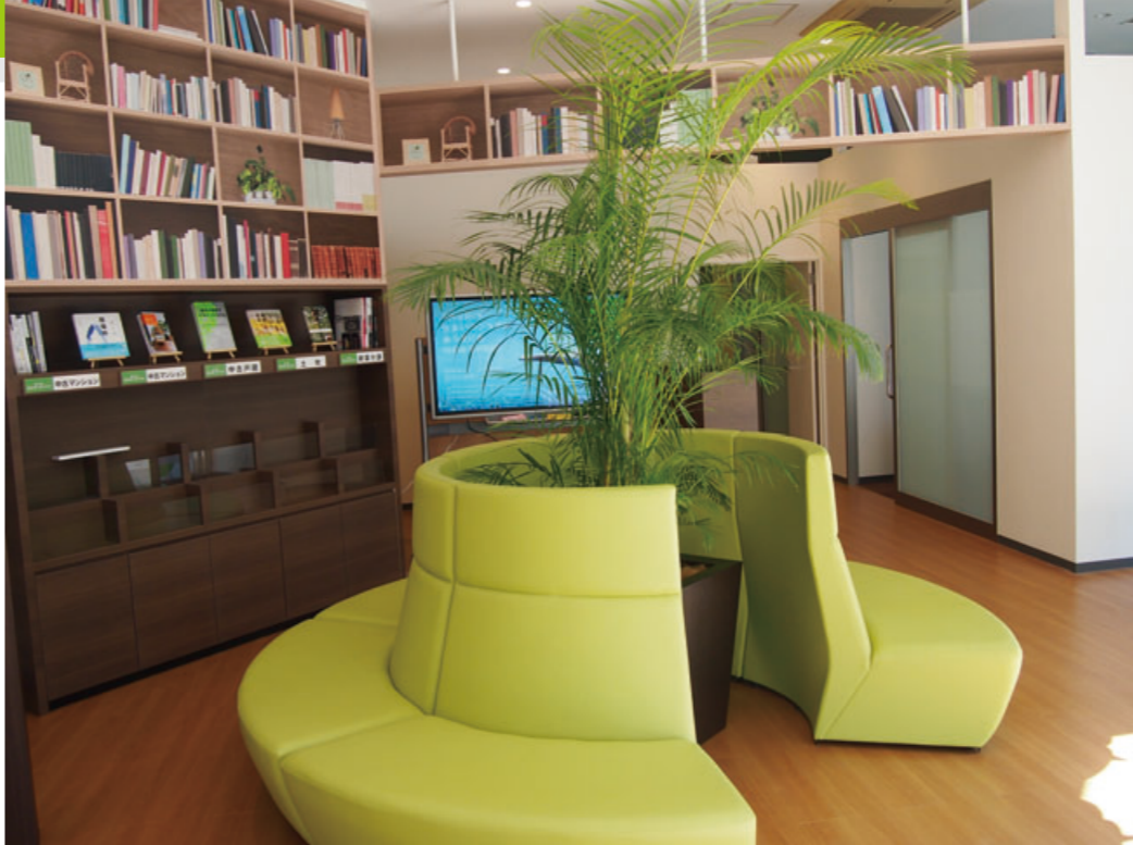
「あつぎ 小田急 住まいのプラザ」の内観。ソファに腰かけ、ドリンクを片手に物件情報などを自由に閲覧できる

沿線での「暮らし」をテーマにした店舗づくりや、地域に根差したイベントなど、「沿線価値の向上」を目指す小田急不動産ならではの取り組みに、今後