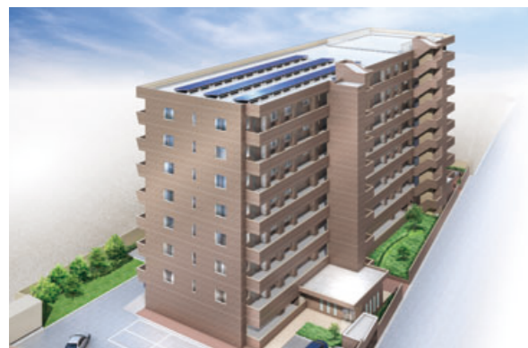
今後は太陽光発電パネルの設置など、環境性能も強化していく予定