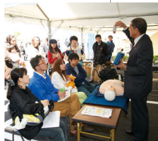
「リリファ松戸」の防災イベントでは、 AEDの使い方体験も実施

第1弾の「リリファ南町田」に始 まり、「リリファつきみ野」「リリフ ファ松戸」など、2年間で8棟の物 件を供給。過去の供給物件は、どれ も好評のうちに完売している。