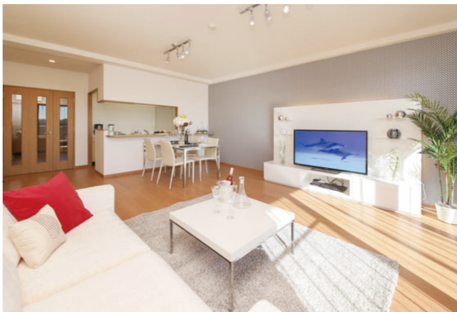
見た目を美しくするだけでなく、給排水設備や防犯設備など機能性・安全性も高め、物件価値を向上

「リリファ」シリーズのもう一 つの特徴は、主に大企業の社宅 物件を選び再生している点だ。 「社宅は営利目的ではなく、社 員の福利厚生のためにつくられ ているので、敷地に余裕があり 構造や間取りの面でも優れてい ることが多い。分譲物件にはな い魅力があります」(四條氏) 買い取った物件は、すべて自 社のスタッフによる検査に加え、 第三者機関が構造体から給排水 に至るまで、検査と調査を行う。 「給排水管はファイバースコー プで中までチェックし、必要が あれば交換します。エントラン