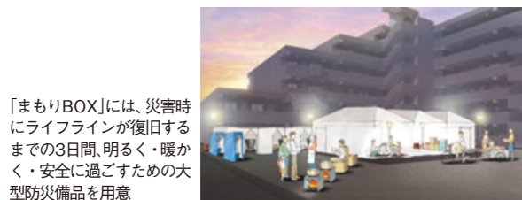
「まもりBOX」には、災害時にライフラインが復旧するまでの3日間、明るく・暖かく・安全に過ごすための大型防災備品を用意

スなどの共用部もすべてリノベ ーションするので、資産価値も 大幅に高まります」(四條氏) また、新たに綿密な長期修繕 計画を立てやすく、修繕積立金 が低く抑えられる点も大きなメ リット。管理についても過剰な ものではなく必要十分なメニュ ーとすることで、管理費を抑え るよう努めている。 こういったランニングコスト の大幅な見直しができるのも、 1棟丸ごとリノベーションなら ではの魅力だ。 さらに、「既存住宅売買瑕疵 担保責任保険」にも加入。万が一 入居後に瑕疵が発覚した場合に も保証が受けられる仕組みだ。