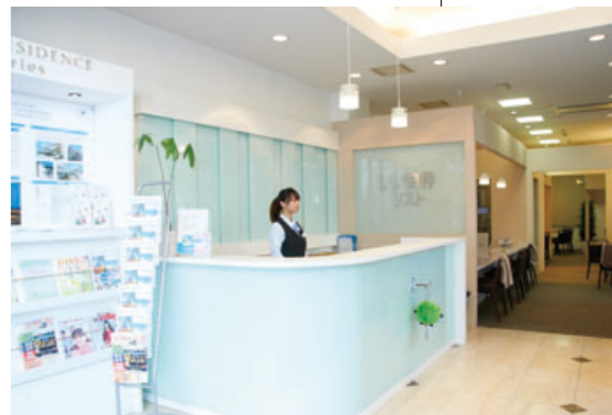
いい物件リスト横浜東口支店の店内