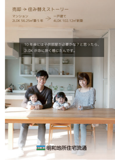
明和地所住宅流通では、不動産仲介はもちろん、顧客のライフスタイルに応じた売却、賃貸、リフォームプランを提案してくれる

渋谷～横浜の縦のラインに、川崎～海老名の横のラインが加わり、サービス網が拡大。今後はさらに店舗を増やし、よりきめ細かなサービスの充実を図る。