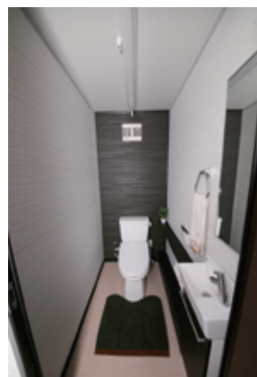
温水洗浄便座付きトイレ