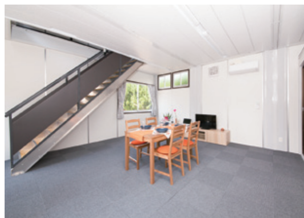
天井が高く、広々としたリビング