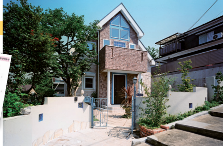
植栽計画も含め、全てウーマンズ・ワークが手掛けた。外観はブルーをアクセントに、扉なども凝った仕様に。「高原の家のように」だと近所でも評判に(上)。内装は白木をベースにした明るいイメージ。吹き抜け部分には将来、部屋の増築も可能(右)

女性らしいアイデアに富んだ「なでしこ」と「空ハウス」。注文住宅をお考えの人は、一度相談してみたいかがだろう。