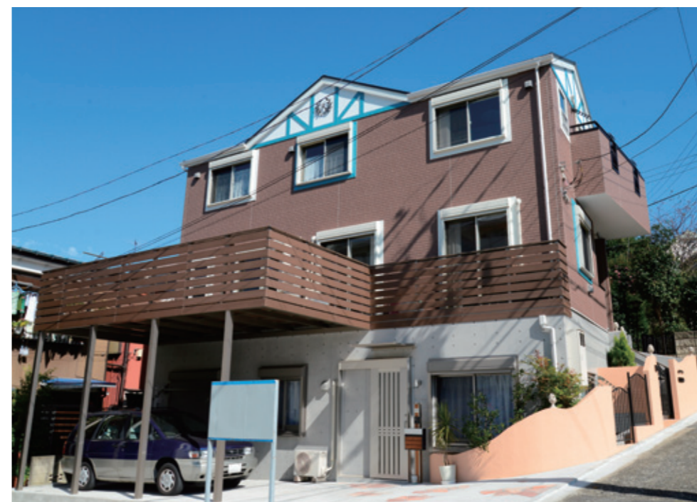
親と同居するために夫婦で新築。1階に娘家族、2階にリビング・キッチン・和室、3階に夫婦、親と息子の部屋がある。土地にはさまざまな建築制限があったが、役所と粘り強く交渉し、できる限り要望を取り入れた。ゆるやかな曲線を描く外構のデザインが美しく(上)、広々とした明るいリビングも印象的だ(左)

リフォーム、増改築、注文住宅などを手掛けるウーマンズ・ワーク。その名の通りスタッフ全員が、建築やインテリアが大好きな女性だ。「全てはお客さまの夢をかなえるために……」を合言葉に、プランの立案、設計、施工に至るまで、女性らしい、細部にまで目の行き届いた丁寧な仕事ぶりが高い評価を得ている。